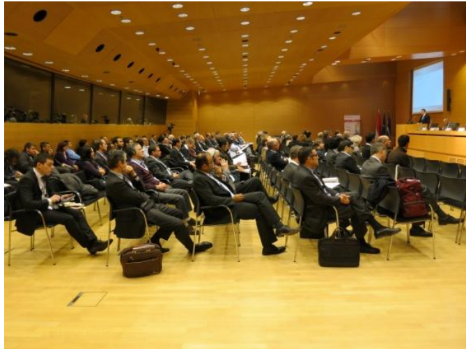
1 er Forum International +Composites - Luxembourg

L'équipe de +Composites a eu l'avantage et le grand plaisir de vous accueillir le 6 décembre 2012 à la Chambre de Commerce de Luxembourg pour le 1 er Forum International +Composites 2012 . Ce fut un grand succès appuyé par la présence de grands noms de l'industrie et augmenté du support de JEC Composites.